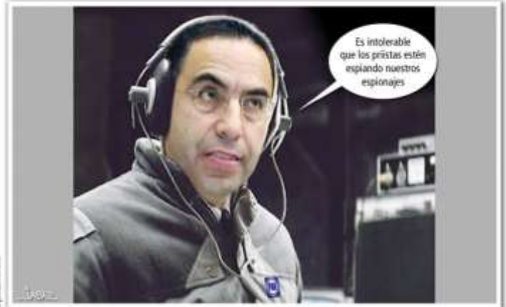
"PINCHE SOTA", DUO MOTA