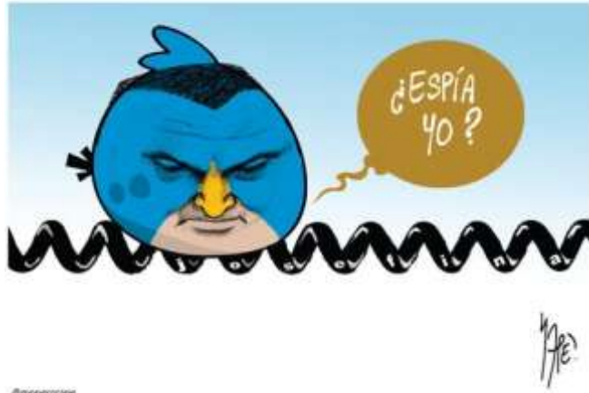
ANGRY GENARO BIRD