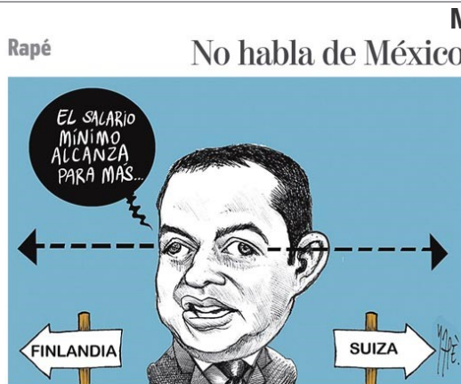
Milenio el país del nunca jabaz Genio incomprendido